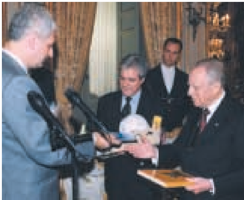
Incontro al Quirinale con il Presidente della Repubblica Carlo Azeglio Ciampi

Un'esperienza che ci ha fatto scoprire positivamente che sono più gli aspetti che ci uniscono, nonostante le diversità, che quelli che ci dividono: un tessuto unitario, di attenzione e rispetto reciproco, un luogo di sartoria civile impegnato per il rafforzamento del tessuto sociale nell'interesse delle associazioni e del Paese soprattutto.