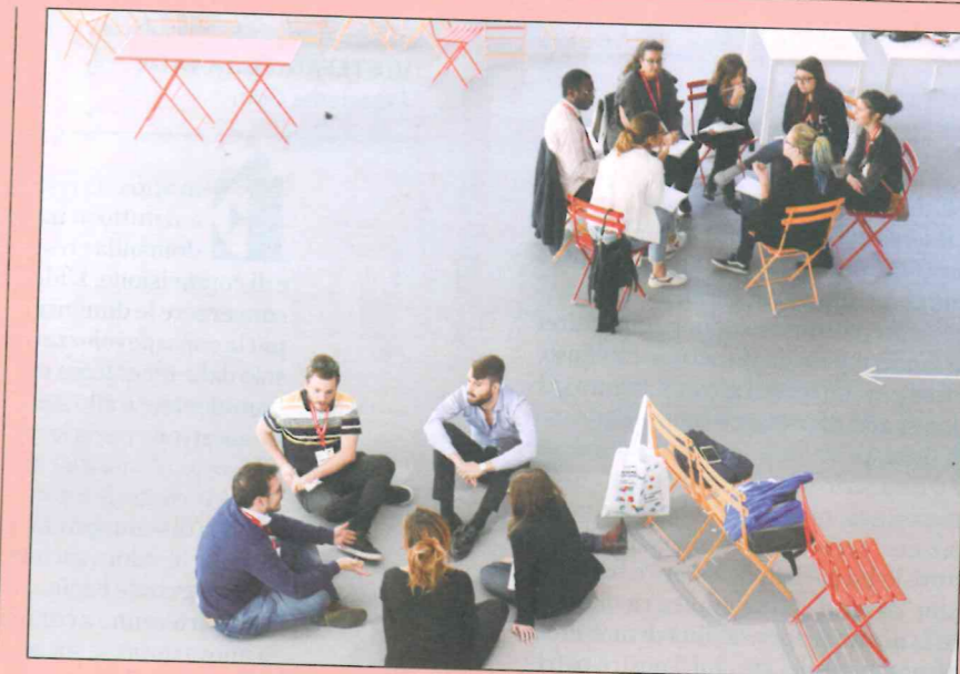
Nell'Opificio Golinelli di Bologna si sono dati appuntamento i 150 under 35 convocati dal Forum del Terzo Settore e dalla Fondazione con il Sud per i 4 cantieri di design sociale

Avevamo chiesto alle associazioni socie del Forum di individuare quattro giovani su cui fare un investimento, quindi c'era una selezione mirata. I giovani che abbiamo incontrato sono mol-