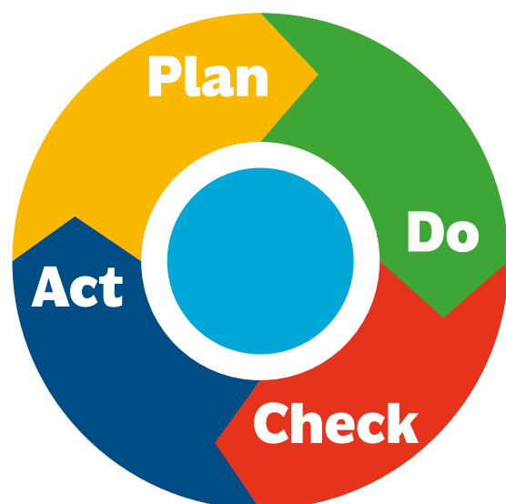
Ciclo di Deming

La programmazione deve rispondere alle classiche domande rispetto a ciò che si intende fare: cosa, chi (responsabilità e figure coinvolte), come, quando (tempistica e step), quanto (risorse necessarie).