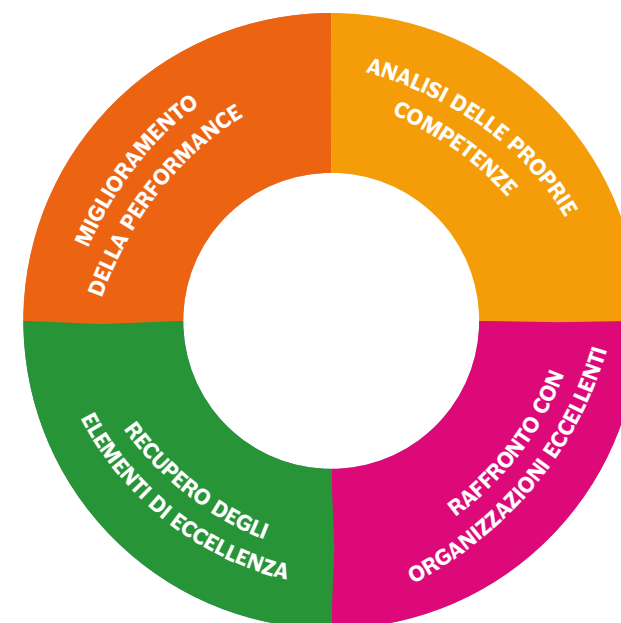
Benchmark - R. Camp

In questo ambito alcuni degli ETS che hanno sperimentato il percorso di adozione del codice hanno deciso di condividere le proprie esperienze nella prospettiva del benchmarking così come rappresentato da R. Camp. Questo percorso di individuazione delle buone pratiche e di confronto continuo per il miglioramento proseguirà nell'adozione e sviluppo dei CQA riconducibili a queste linee guida.